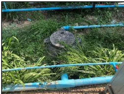
รูปที่ 1-7 ระบบบำบัดน้ำเสีย บริเวณพื้นที่ก่อสร้างโครงการ

ก่อสร้างโครงการ จากการประเมินอัตราการใช้น้ำในการก่อสร้างโครงการ พบว่า ส่วนใหญ่หมดไปกับขั้นตอนการก่อสร้าง จึงไม่นำน้ำใช้ในส่วนของกิจกรรมการก่อสร้างมาคิดรวม ส่วนที่เหลือมีปริมาณเพียงเล็กน้อยจึงปล่อยให้ซึมลงดินและแห้งไปเองตามธรรมชาติ