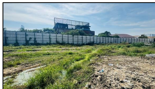
สภาพปัจจุบันของโครงการ (วันที่ 25 ธันวาคม พ.ศ. 2567)