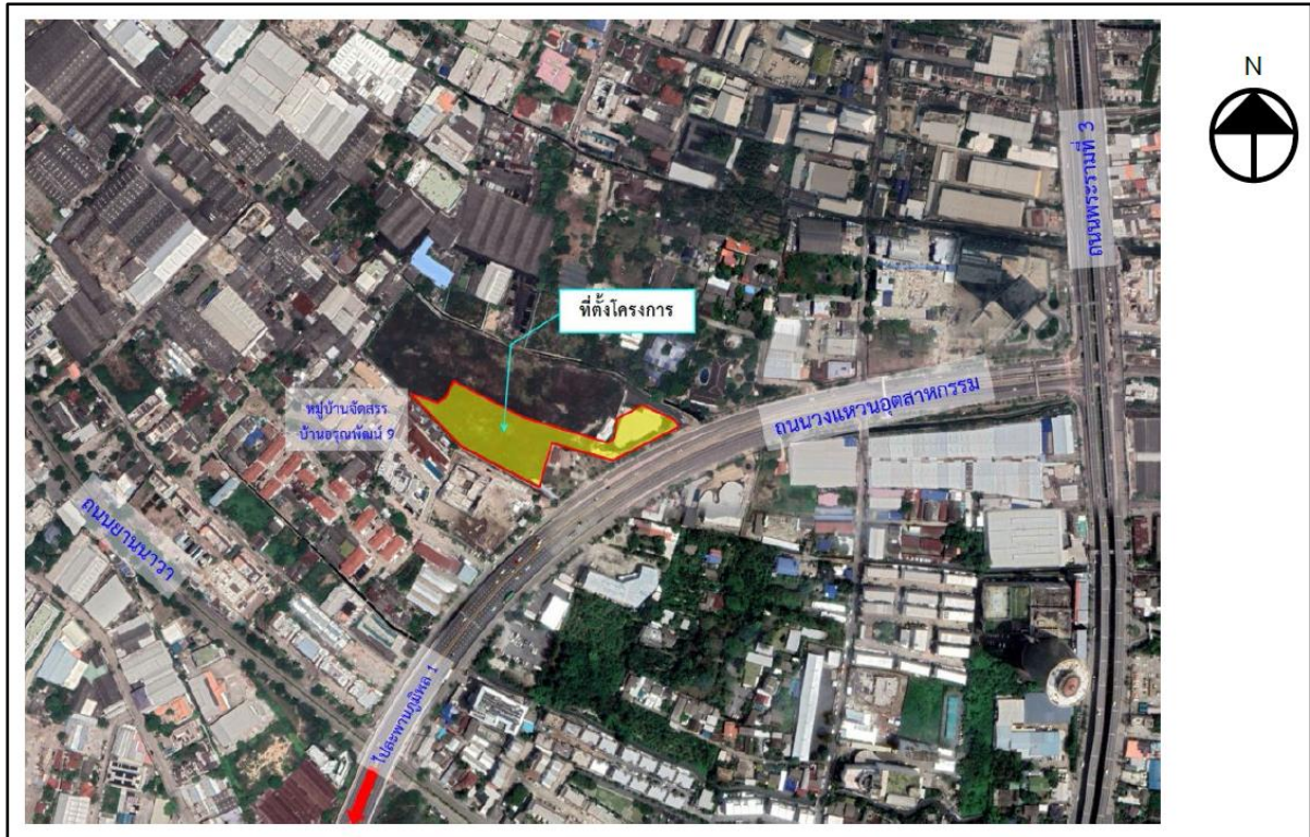
รูปที่ 1-1 แผนผังแสดงที่ตั้งโครงการ