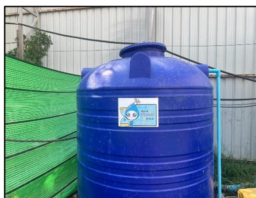
รูปที่ 1-6 ถังสำรองน้ำสำเร็จรูป บริเวณพื้นที่ก่อสร้างโครงการ